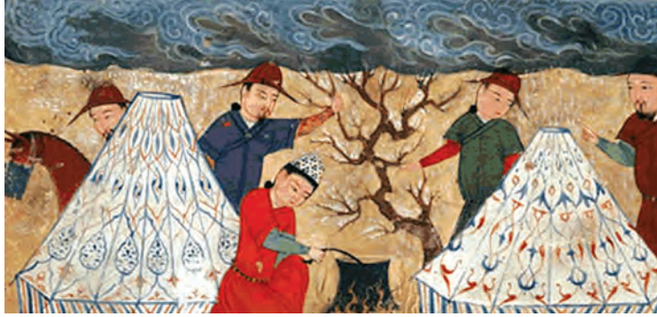
कुबलाई खान और चाबी, शिविर में