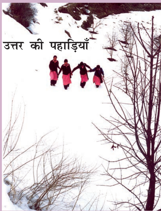
उत्तर की पहाड़ियाँ